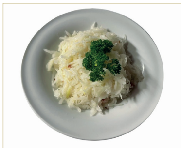
609 Insalata di krauti con speck 6, 7