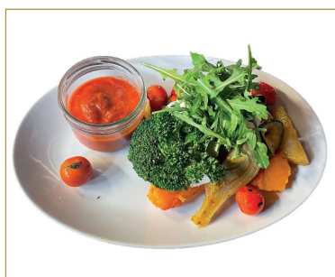
335 Verdure arrosto con arugola e salsa pomodoro N