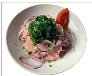
502 Insalata di würstl e cipolle rosse, detta anche monachese 4, 6, C, A, B, D, H, I, J, K, N