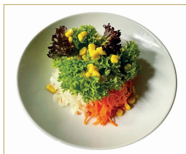
607 Insalata mista 6, 7, N, 8, D