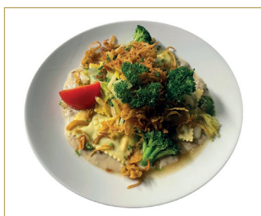
820 Ricotta- spinachi- Ravioli con verdura e funghi pann 4, A, C1, C, D, H, N