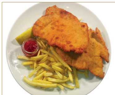
660 Cotoletta alla viennese con patatine fritte